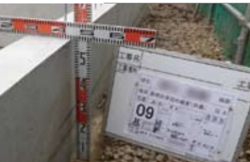
高機能の家を支える基礎。検査は万全。

ポイント 「長期優良住宅」や「住宅性能表示制度」は、家を提供する企業にとって、高品質の家をつくる姿勢や信頼度をアピールする有効な手段の一つとなっています。こちらのお宅は、耐震、耐風、劣化、維持管理などが最高の等級。オプションの音環境に対する評価も取得しており、品質に対するお父様のこだわりを感じました。