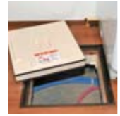
メンテナンス用の点検口にもしっかり断熱加工。

ポイント このお宅は積雪地域内にあるので、「構造の安定に関すること」の項目のなかに「耐積雪等級」がありました。屋根に雪が積もっても壊れないかという評価です。「住宅性能評価」の事項にはこのように特定の地域のみ適用されるものがあります。またオプションである音環境の評価も取得していました。風が強くても防音効果が高いので静かに感じます。