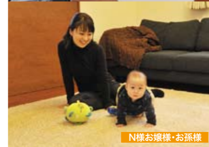
N様お嬢様・お孫様