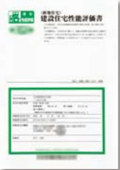
建設住宅性能評価書