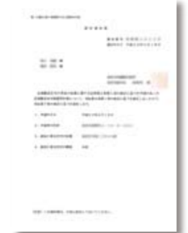
長期優良住宅認定通知書