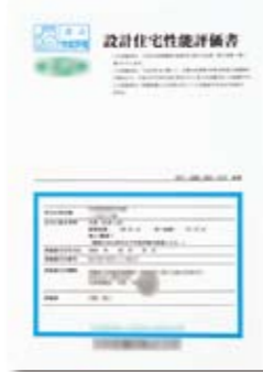
設計住宅性能評価書