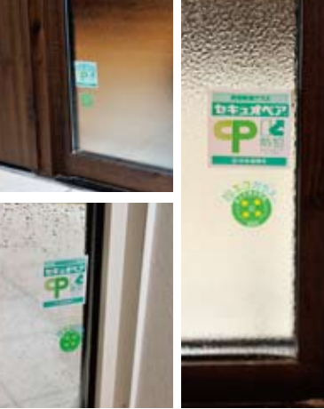
CP マークは防犯対策を施した証で、官民合同会議による目録掲載品に貼付される共通標準章です。

外は雨・雪・あられ。室内は年中快適。 冬の北陸はめまぐるしく天気が変わるんです。風も強いですしね。雪が降ったかと思つとパツと晴れて、しばらくするとあられになって、雨が降って。でも家の中は気温が一定だから、窓の外で景色がどんなに変わっていても快適ですから平和なものです。風がゴーゴーいついていても、部屋にいと聞こえないですね。外に出るときに初めて「こんなに風が吹いていたの？」と気がつくくらいです。今は窓ガラスの性能もいいですね。結露にもなりにくく、紫外線もカットすると聞きました。窓辺でも安心して過ごせますよ。